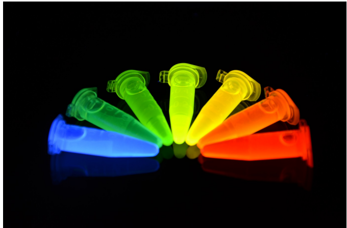
Bild 1: Spektrum von Indiumphosphid Quantenpunkten

Das Verbundvorhaben EndoProve adressiert Aktivitäten zur Erforschung eines innovativen Nanopartikel-basierten photonischen Nachweisverfahrens zum schnellen und zuverlässigen Vor-Ort-Nachweis von Endotoxinen bei der Herstellung von Biopharmazeutika. Hierzu werden Photonik und Nanotechnologie als Schlüsseltechnologien des 21. Jahrhunderts zusammen mit der Biotechnologie kombiniert.